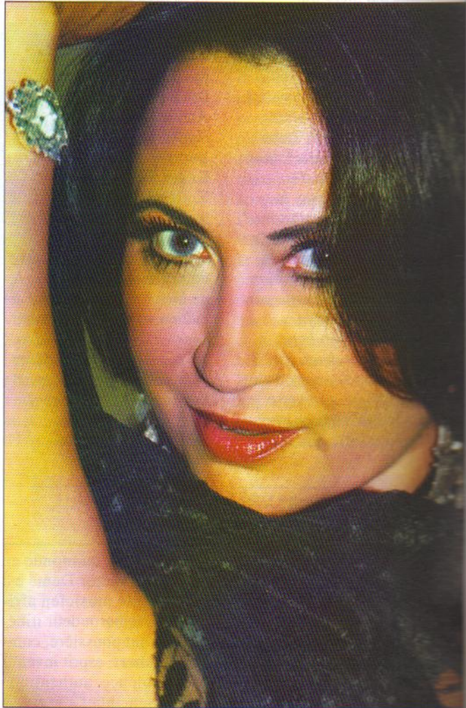
Une personnalité métissée aux racines profondes.

La chanteuse brosse avec soin son portrait qui correspond peu à peu à la musique qu'elle fait, à la fois délicate et forte. Elle rappelle les facettes multiples de Belleville, le quartier de Paris où elle a grandi, carrefour de gens aux origines disparates, symbole même de la métropole pluriculturelle. « J'ai été élevée par ma grand-mère. Elle était sage et m'a appris des valeurs inébranlables. Mes racines sont profondes et, même si je suis moderne avec une personnalité très métissée, je garde un côté rétro, à l'ancienne, comme s'il y avait deux femmes en moi. » Dans son style unique, une couleur prime, celle de l'Orient. « La musique orientale est très complexe, tantôt mélancolique, tantôt rythmée. Son orchestration